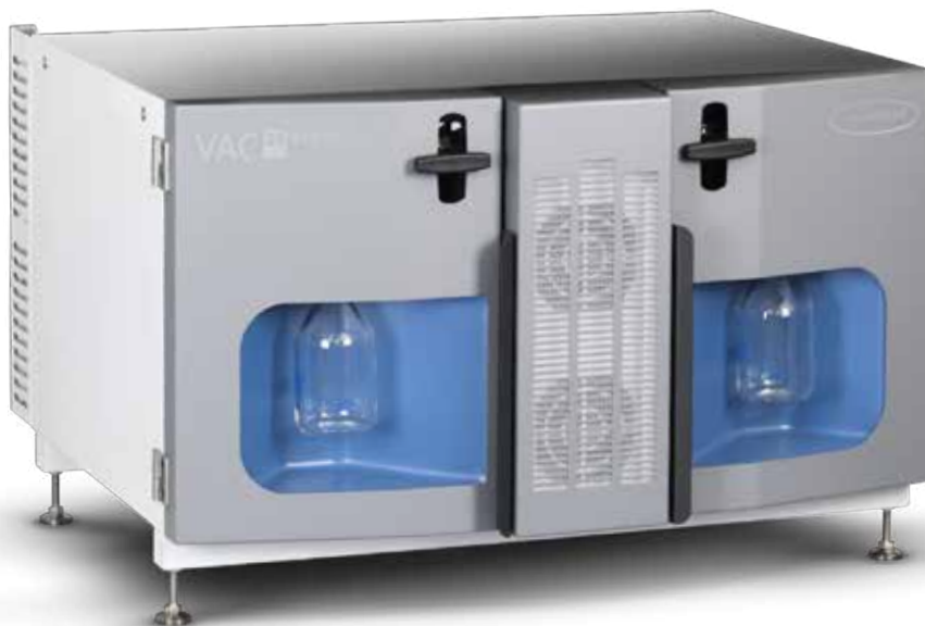
VAC 24seven НАСОСНЫЙ МОДУЛЬ